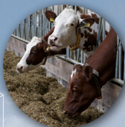
Voeding en water